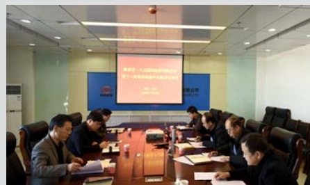
一八五公司召开党委理论中心组第十一次集体学习会议。