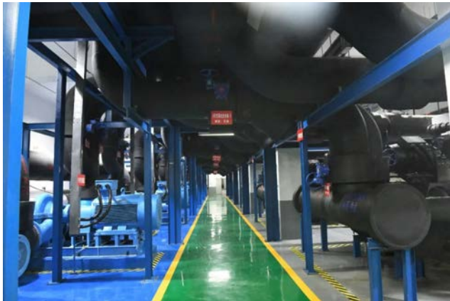
宝鸡代家湾中水源供热供冷中心项目机房

与此同时，陕煤地质集团中煤新能源公司树品牌、创一流，全面布局地热能开发利用项目的落地实施。