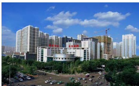
陕煤地质集团办公大楼

研究机构联合开展各种产学研合作，与西安交通大学、长安大学、西安建筑科技大学等共同建立合作课题研究，培养专业人才；同时，与瑞典罗特公司建立长期战略合作关系，进行深度学习交流及技术引进，使陕煤地质集团始终走在清洁能源技术的前沿。