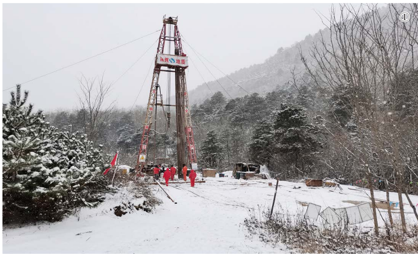
① 11月23日，一九四公司黄陵建北煤矿水文地质补充勘探项目抽水试验下水泵。